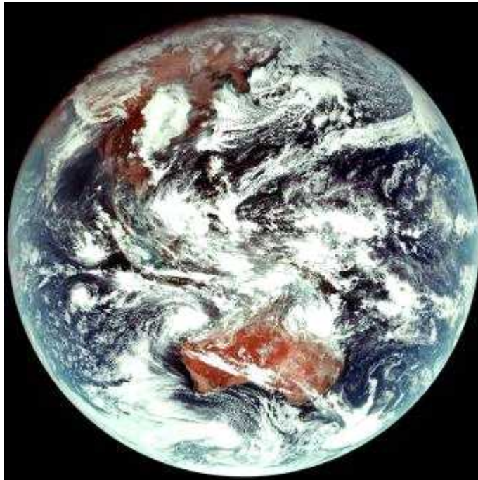
< 천리안위성 2A호 첫 관측영상 >