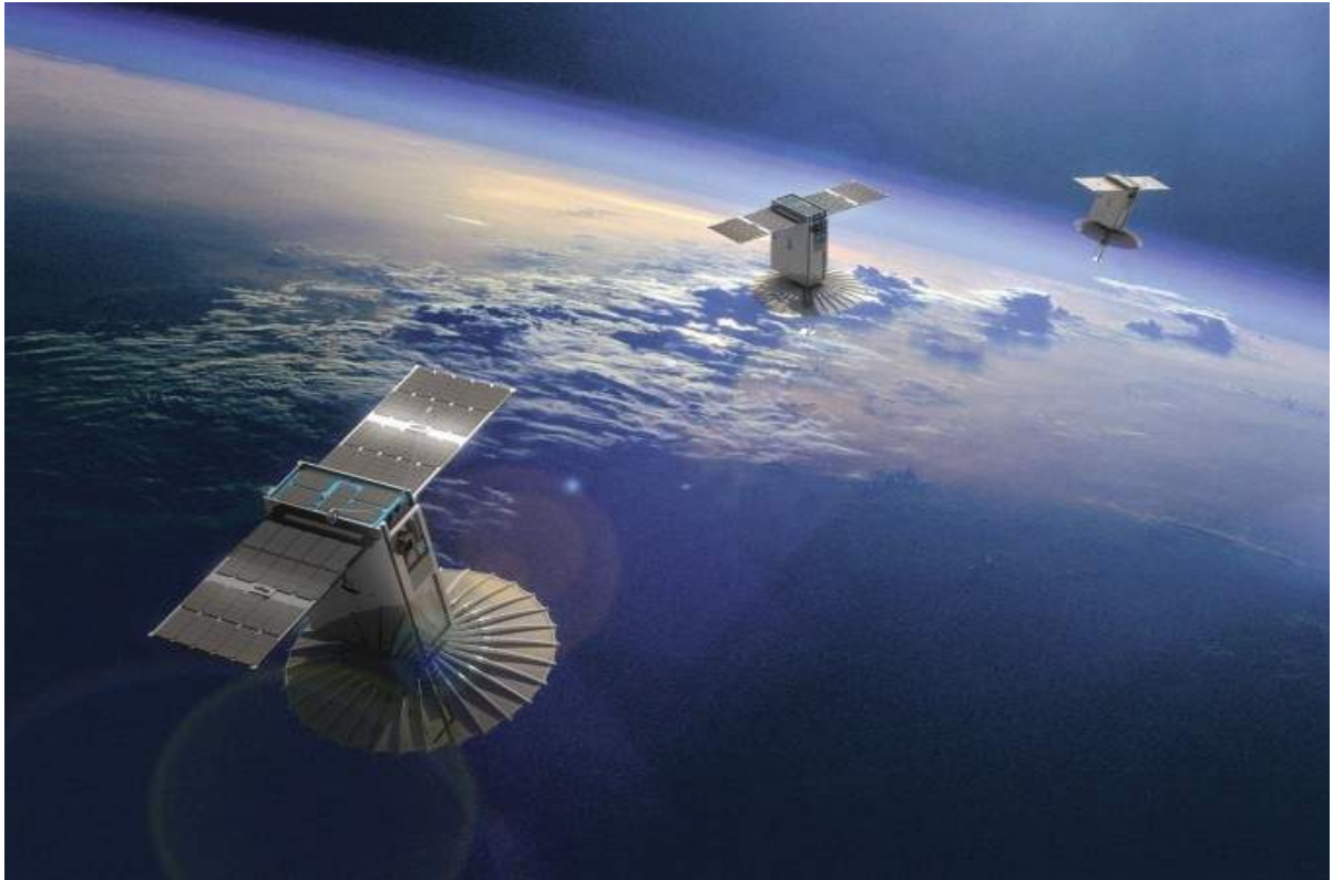
〈 대형 위성 1개 대신 초소형 위성 여러 개를 띄워 군집으로 활용하는 모습 〉