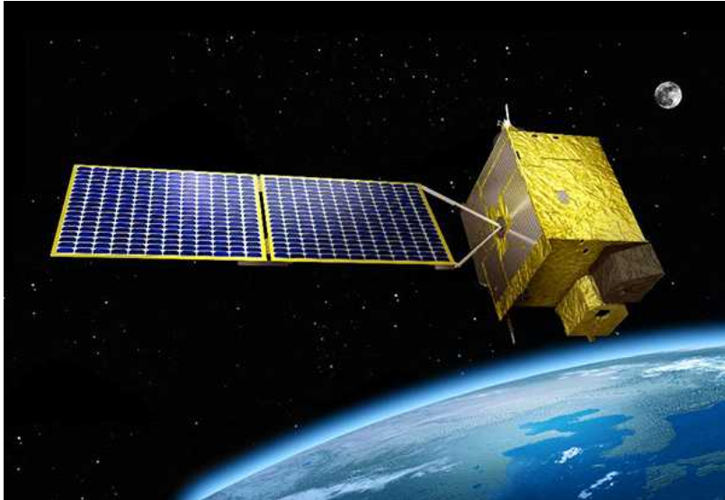
지난 2020년 2월 19일(한국시간) ?우리 독자기술로 개발된 세계 최초의 환경감시 정지궤도위성 ‘천리안위성 2B호’가 남미 기아나 우주센터에서 성공적으로 발사됐다. 사진은 천리안위성 2B호 상상도.