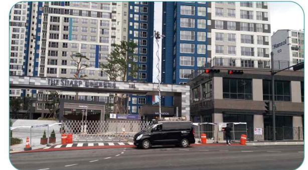
〈신축아파트 준공허가(방송시스템) 전파환경 수탁 측정〉